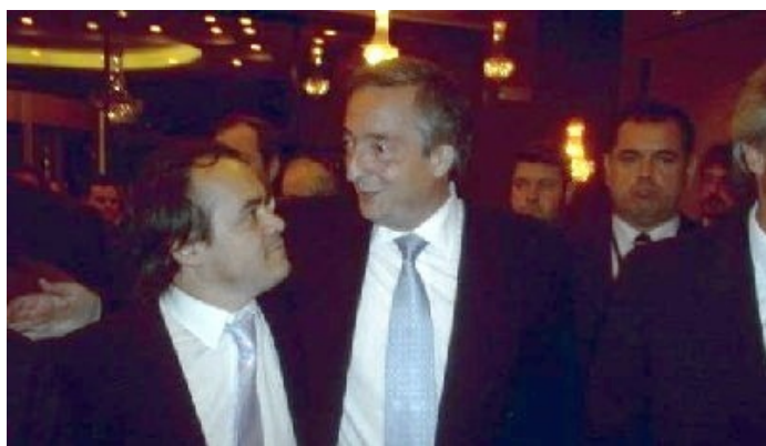
Junto al Presidente en Misiones - Acompañamos a la delegación oficial en el viaje.