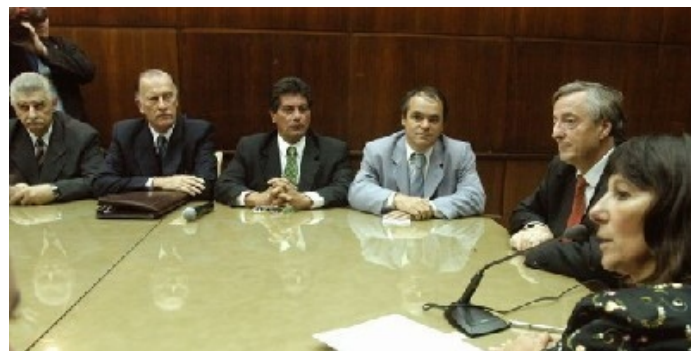
Ministerio de Economía - Junto a la Cadena de Valor del Cuero derogando la Res. 655-05