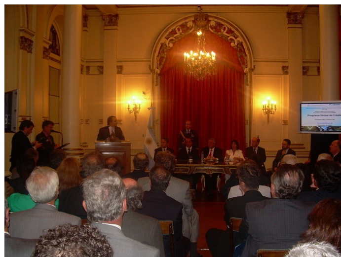
Casa Rosada diciembre 2006 - Anunciamos con orgullo el plan de crédito global para Pymes.